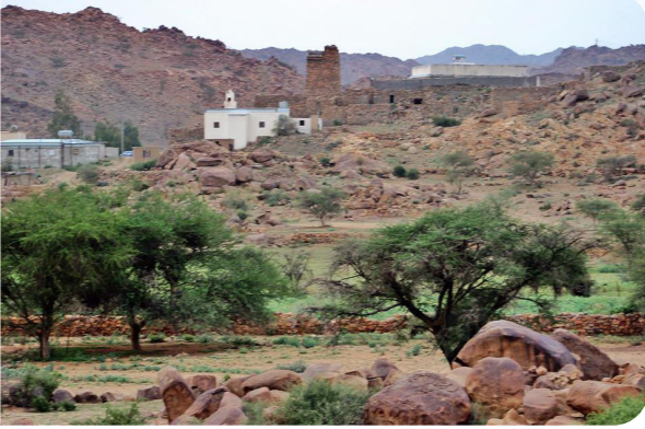
قرية بني سعد

وعاش معهم ستين في بني سعد، وعندما كان صغيراً جاءه ملكان من السماء فشقاً صدره ونظفا قلبه من المعاصي حتى صار نقياً.